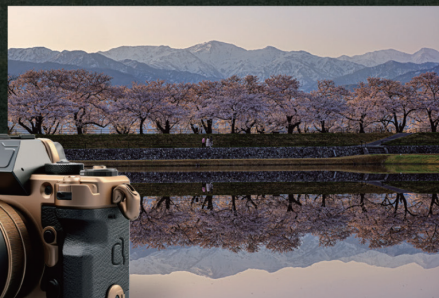
JAPAN TRAILフォトコンテスト2024受賞作品